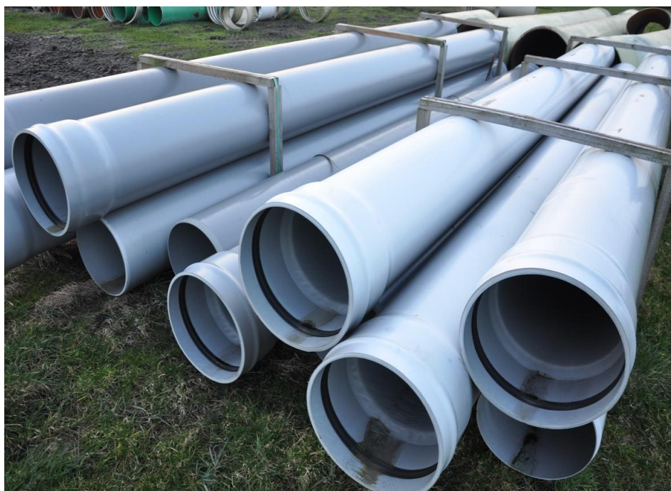
Figuur 2 - Duiker van PVC

Een duiker van PVC (Figuur 2) is een kokervormige constructie met als hoofdfunctie het verbinden van twee wateren.