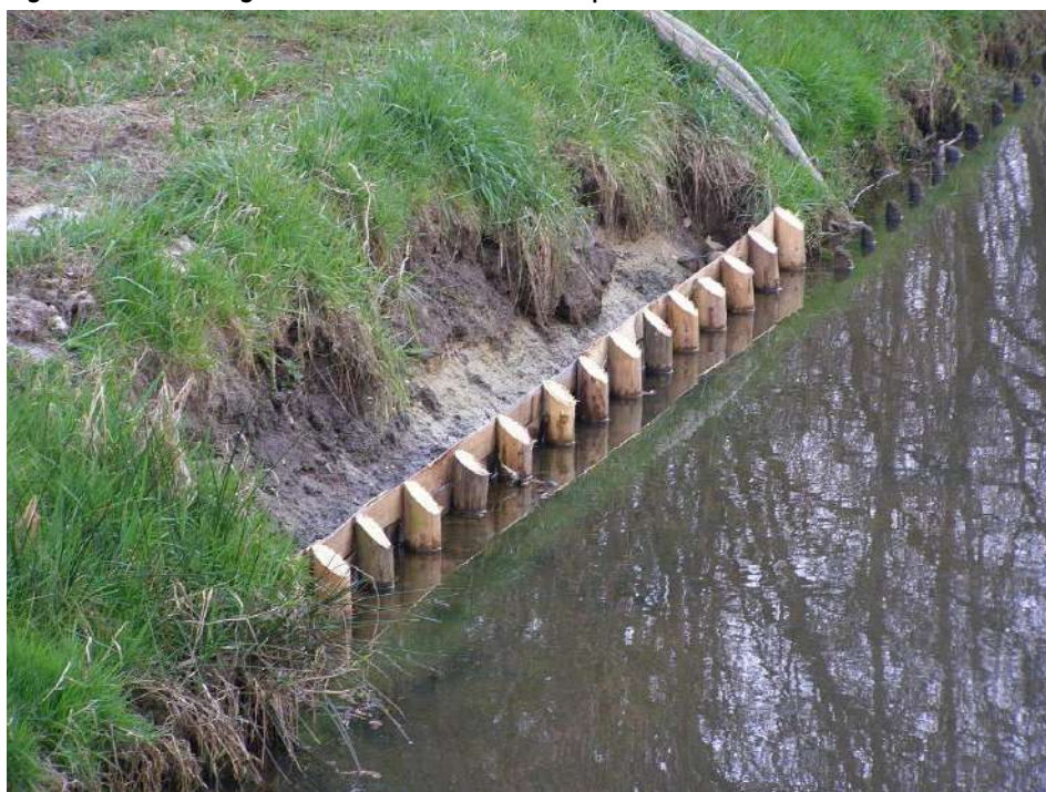
Figuur 2 - Beschoeiingselement van naaldhout en tropisch hardhout