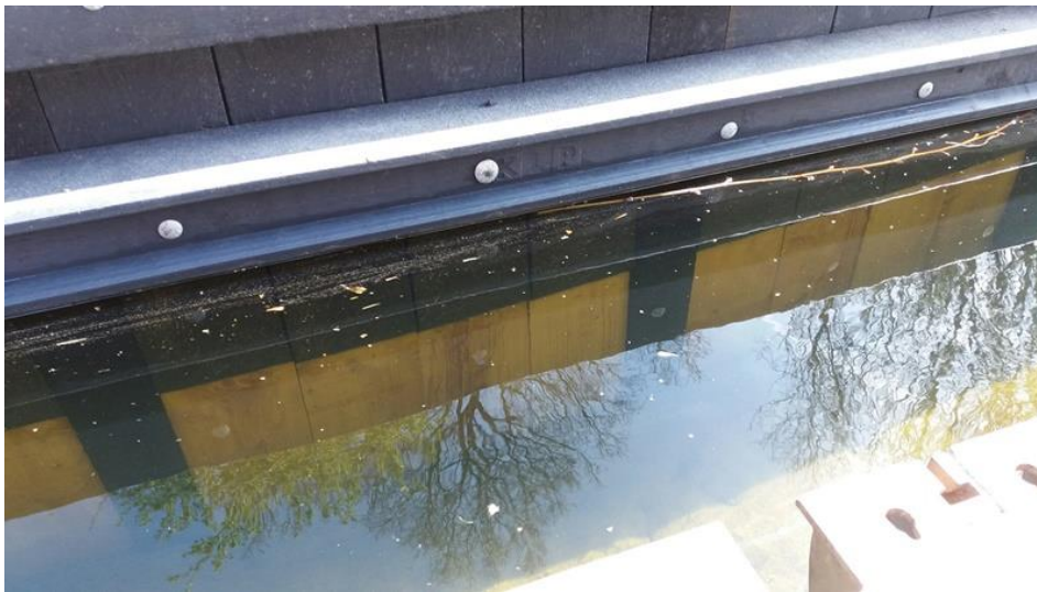
Figuur 2 - Damwand van Europees naaldhout en gerecycled kunststof