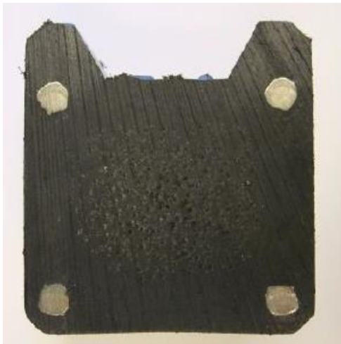
Figuur 4 - Doorsnede staalversterkte gording