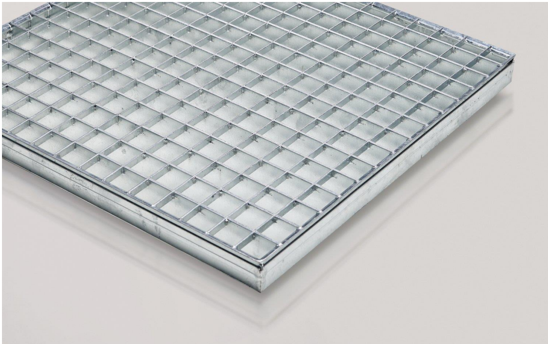
Figuur 2 - rooster van gecoat staal

Een rooster van gecoat staal (Figuur 2) is een rooster dat gebruikt wordt als bordesbedekking, looproosters of traptreden.