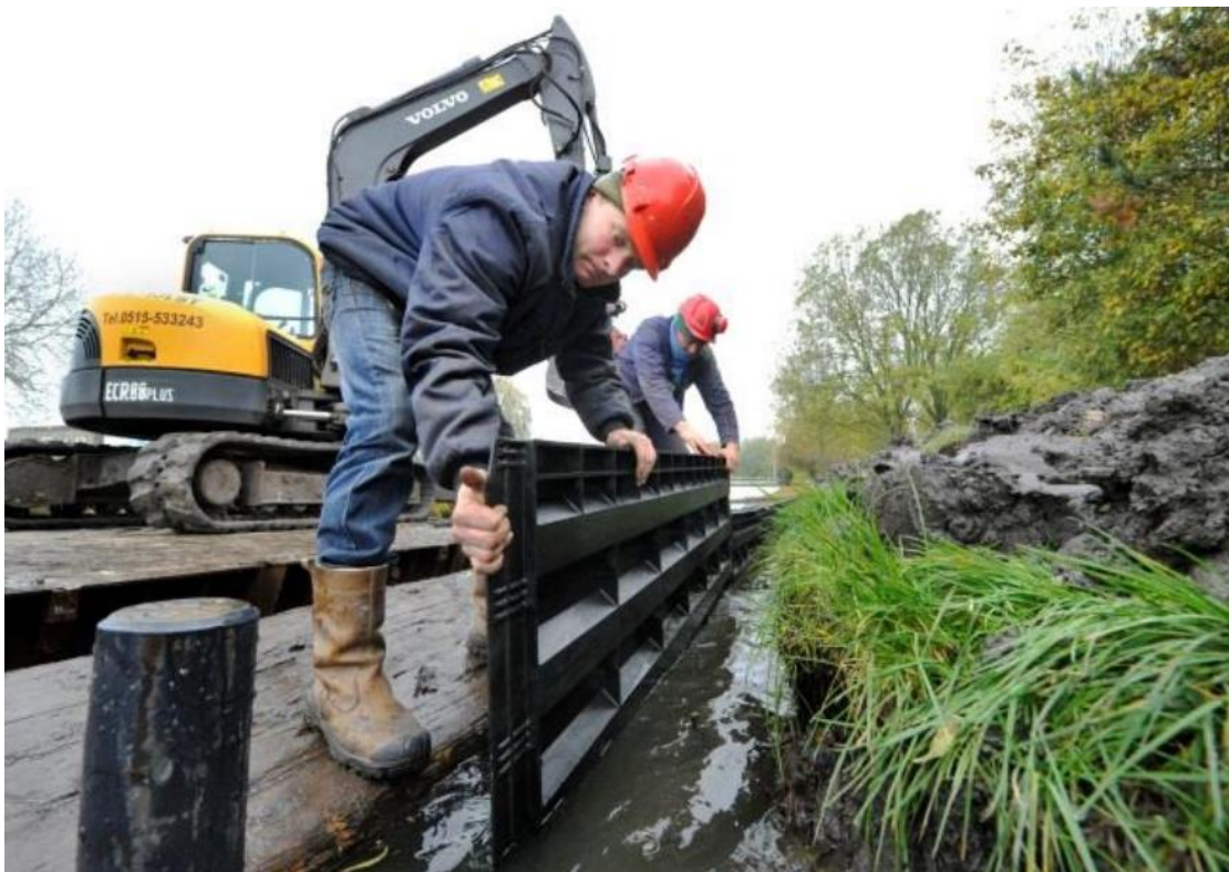
Figuur 2 - beschoeiingselement van gerecycled kunststof