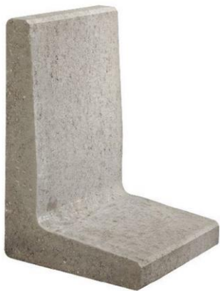
Figuur 2 - Keerwand (gording niet weergegeven)

Deze keerwand bestaat uit gewapend beton en heeft een houten gording. Er wordt hier uitgegaan van een gemiddelde variant, die 1,5 x 1,0 x 0,85 m groot is. Ook wordt meegenomen dat hierbij een zandbed van 0,25 m dik toegepast wordt.