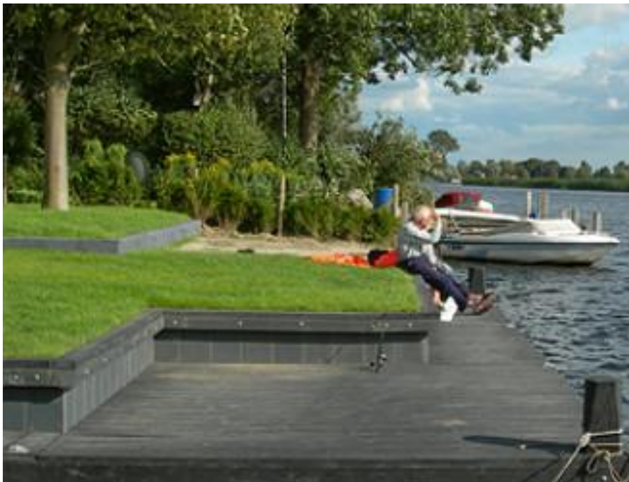
Figuur 2 - Damwand van gerecycled kunststof