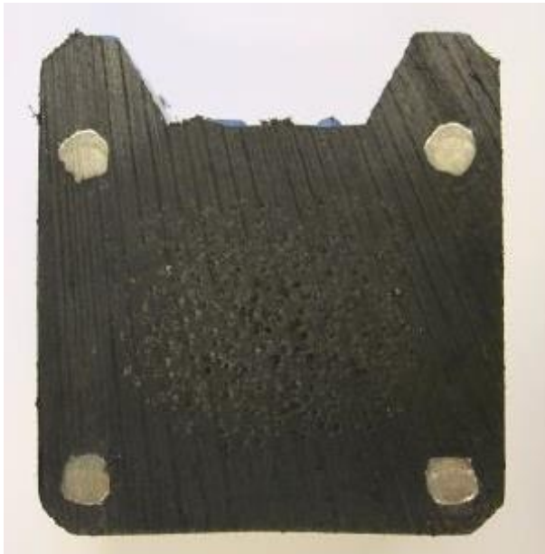
Figuur 3 - Doorsnede staalversterkte gording