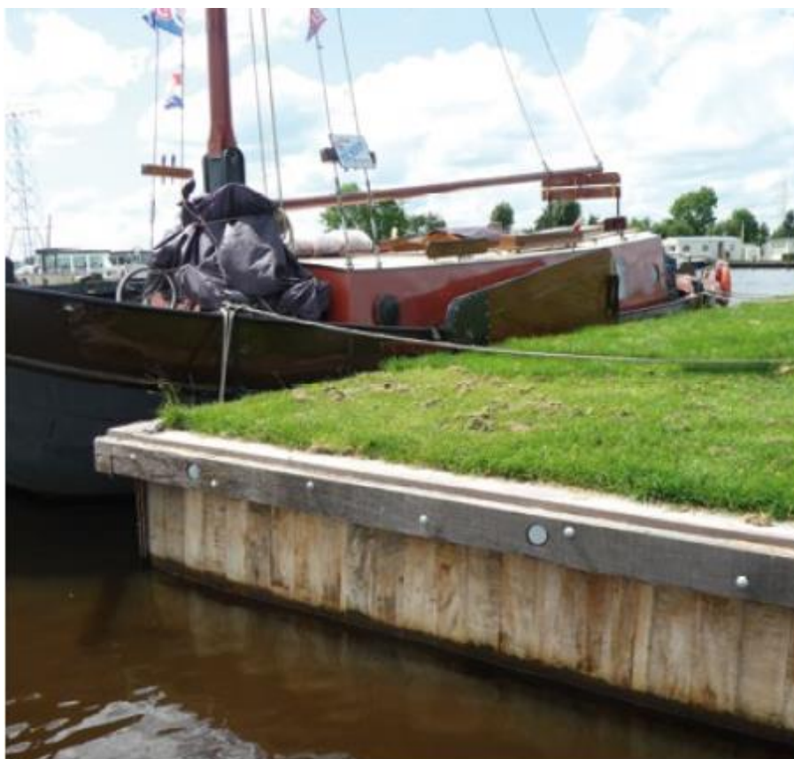
Figuur 2 - Damwand van naaldhout en tropisch hardhout

Een damwand (Figuur 2) is een wand met als hoofd-functie grondkering. Daarnaast kan het dienen als kademuur, oeverbescherming of ter immobilisatie van bodemvervuiling.