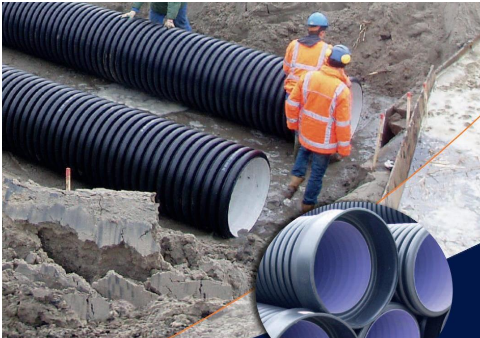
Figuur 2 - Duiker van PE

Een duiker van PE (Figuur 2) is een kokervormige constructie met als hoofdfunctie het verbinden van twee wateren.